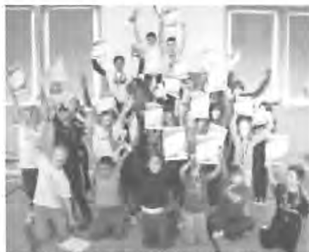
Strahlende Gesichter bei den Siegern

sechs Gruppen die Sieger sowie die Zweit- und Drittplatzierten ermittelt. Neben Urkunden und Pokalen nahmen sie auch Sachpreise mit nach Hause