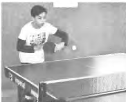
Volle Konzentration an der Platte

Schnell füllte sich die Halle. 39 Jungen und 15 Mädchen aus den Jahrgängen 1999 bis 2003 (und jünger) kämpften mit vollem Einsatz und hoher Konzentration um Spiel, Satz und Sieg.