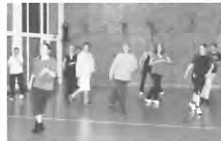
„Swing“ in der WTB-Fitnesshalle

wurden durch Dehn-, Streck- und Entspannungs-Übungen ergänzt. Zur Halbzeit gab es eine kurze Pause, damit der Flüssigkeitsverlust durch das schweißtreibende Aerobic