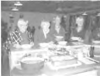
Andrang beim reichhaltigen Buffett

An festlich geschmückten Tischen wurden selbstgemachte italienische Köstlichkeiten aufgetischt. Antipasti, Minestrone, Pasta und Lasagne fanden allseits großen Zuspruch.