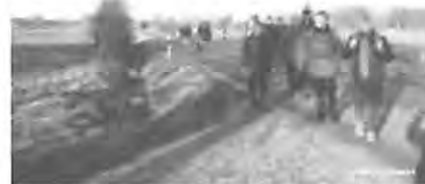
Es geht in den Duvenstedter Brook

Der Bus 7550 bringt uns nach Kayhude und der Bus 8140 zum Krögersweg in Bargfeld-Stegen. Um 09:50 Uhr startet die Truppe zur Wanderung durch die Feldmark und durch den Jersbeker Forst nach Pflingsthorst. Nach einem kurzen Stück Landstraße biegen wir ab in den Duvenstedter Brook.