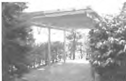
Raucherunterstand am Vereinshaus.

(khz) Als unser Vereinsheim vor annähernd zwei Jahren renoviert wurde, haben wir es zur „rauchfreien Zone“ bestimmt. Seitdem standen die Raucher manchmal buchstäblich im Regen, was zu der einen oder anderen Verstimmung geführt hatte.