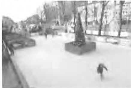
„Like Ice“ – Bahn beim Wandsbeker Winterzauber

Die Kunsteisbahn brachte sehr hohe Energiekosten mit sich. Deshalb wurde das Konzept geändert. Seit vergangem Jahr besteht die Eislauffläche aus einem wiederverwertbaren Kunststoff und wird als „Like Ice“ (auf gut deutsch: „wie Eis“) bezeichnet.