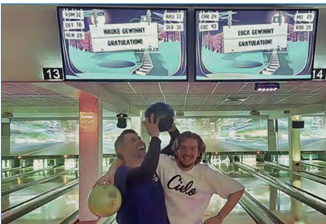
Volleyball mal anders – ab Seite 4