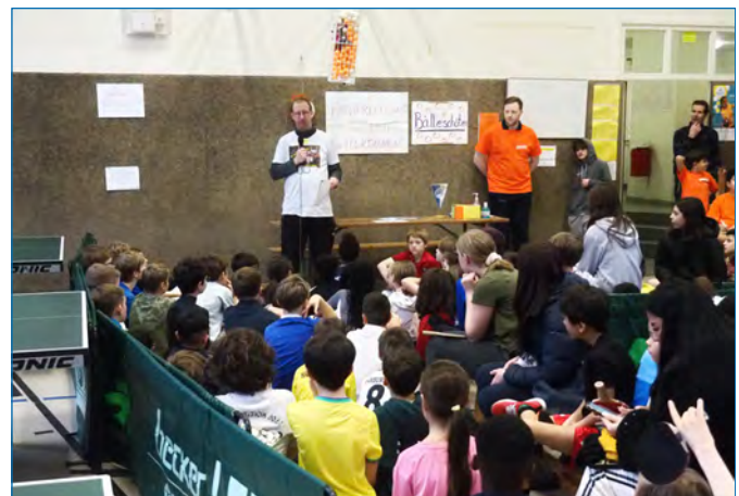
Andrang beim Mini-TT-Turnier – auf Seite 10