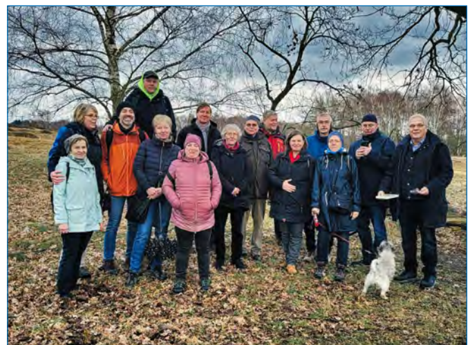
Und auch das – Wandern auf Seite 15

Der Redaktionsschluss für die nächste Ausgabe ist Sonntag, 29. Mai 2023. Beiträge bitte per Mail an presseteam@wtb61.de .