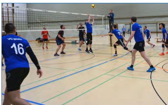
Unsere 2. Herren zuhause

Im August ist dann auch wieder die FIVB mit ihren Top-16-Teams im Beachvolleyball zu