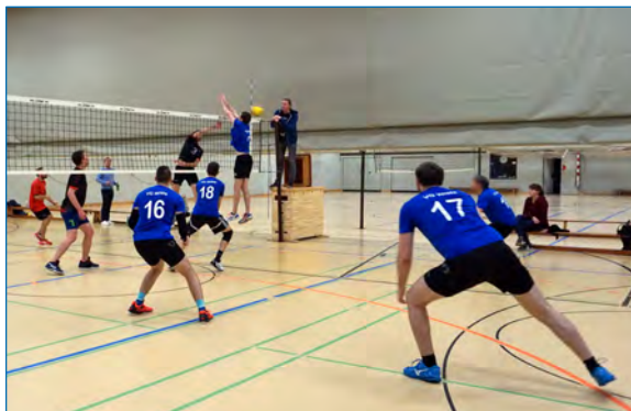
Foto: 2. Herren