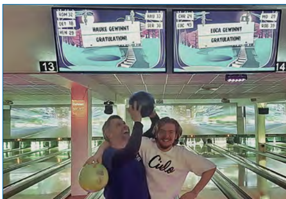
Unsere Teams beim Kegeln oder Bowlen