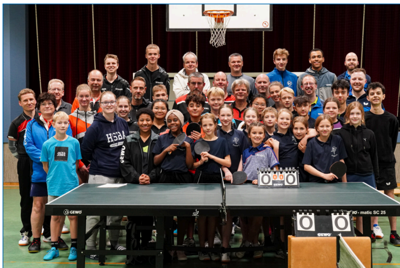
St. Michaelis- donn oder Micheldonn?

Powernapping, 2. TT-Einheit, Rückfahrt, Abendessen, und häufig haben wir nach dem Abendessen oder vor dem Frühstück noch gemeinsam